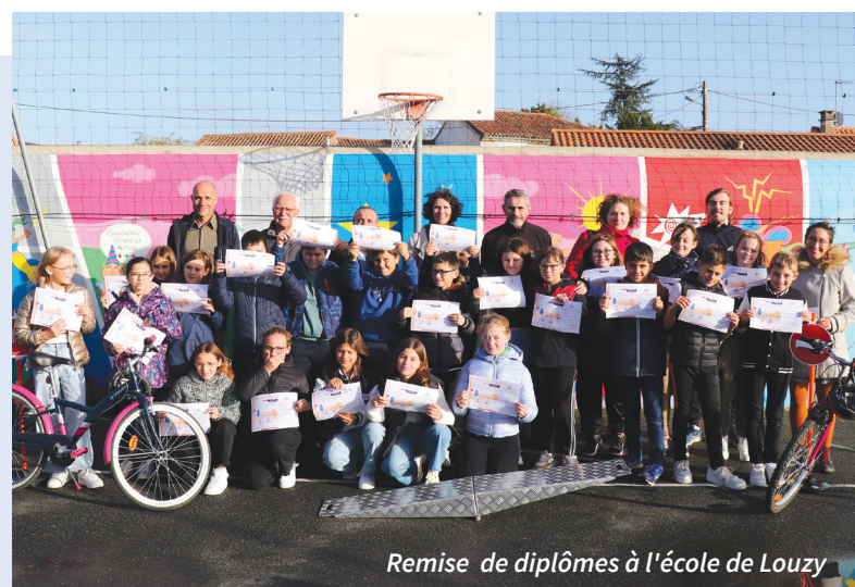
Remise de diplômes à l'école de Louzy

L'objectif du SRAV est de permettre aux enfants d'être autonomes à vélo avant l'entrée au collège.