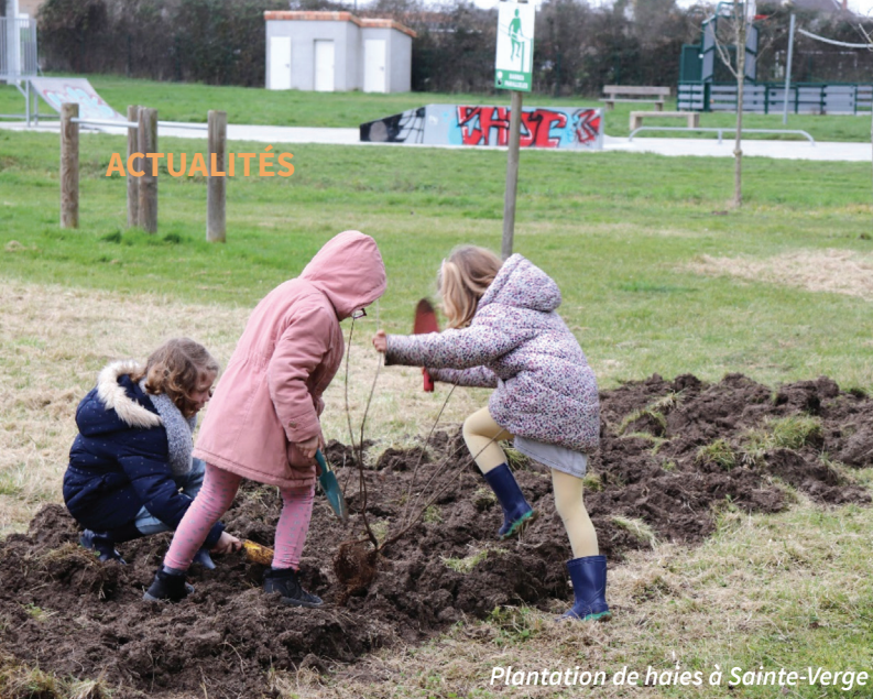
Plantation de haies à Sainte-Verge