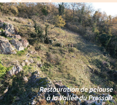
Restauration de pelouse à la Vallée du Pressoir

Ces plantations contribueront à améliorer le cadre paysager ainsi que la Trame Verte et Bleue du territoire (réseau de continuités écologiques nécessaires au déplacement de la faune et de la flore).